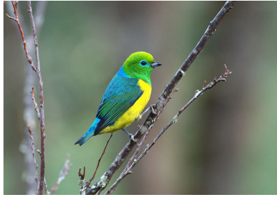
Figura 3 – Bandeirinha ( Chlorophonia cyanea ).

Sed ac odio. Sed vehicula hendrerit sem. Duis non odio. Morbi ut du. Sed accumsan risus eget odio. In hac habitasse platea dictumst. Pellentesque non elit. Fusce sed justo eu urna porta tincidunt. Mauris felis odio, sollicitudin sed, volutpat a, ornare ac, erat. Morbi quis dolor. Donec pellentesque, erat ac sagittis semper, nunc du lobortis purus, quis congue purus metus ultricies tellus. Proin et quam. Class aptent taciti sociosqu ad litora torquent per conubia nostra, per inceptos hymenaeos. Praesent sapien turpis, fermentum vel, eleifend faucibus, vehicula eu, lacus.