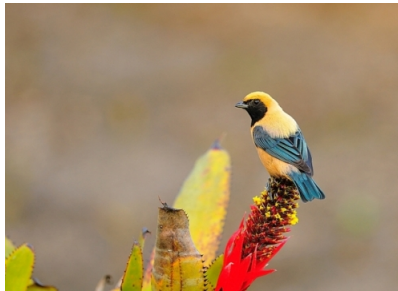
Figura 2 – Saíra-amarela ( Tangara cayana ).

dunt sit amet, laoreet vitae, arcu. Aenean faucibus pede eu ante. Praesent enim elit, rutrum at, molestie non, nonummy vel, nisl. Ut lectus eros, malesuada sit amet, fermentum eu, sodales cursus, magna. Donec eu purus. Quisque vehicula, urna sed ultricies auctor, pede lorem egestas dui, et convallis elit erat sed nulla. Donec luctus. Curabitur et nunc. Aliquam dolor odio, commodo pretium, ultricies non, pharetra in, velit. Integer arcu est, nonummy in, fermentum faucibus, egestas vel, odio.