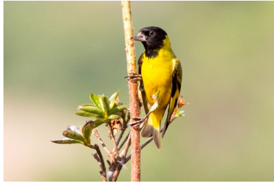
Figura 1 – Pintassilgo ( Carduelis magellanicus ).